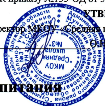
График горячего питания